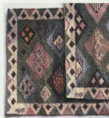
Ur utställningen Märta Måås-Fjetterström på Nordiska museet.