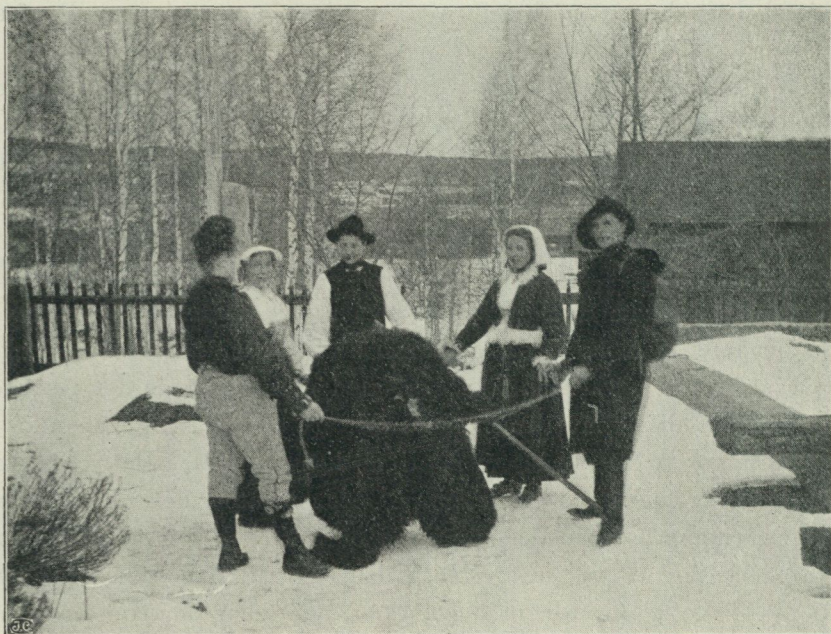
Fig. 4. Mats-firande med »björn» i Gagnef.