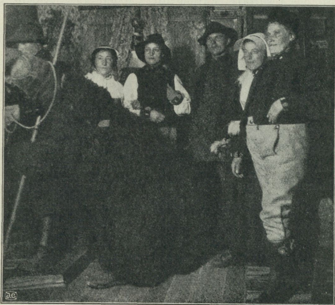
Fig. 5. Mats-firande med »björn» i Gagnef.