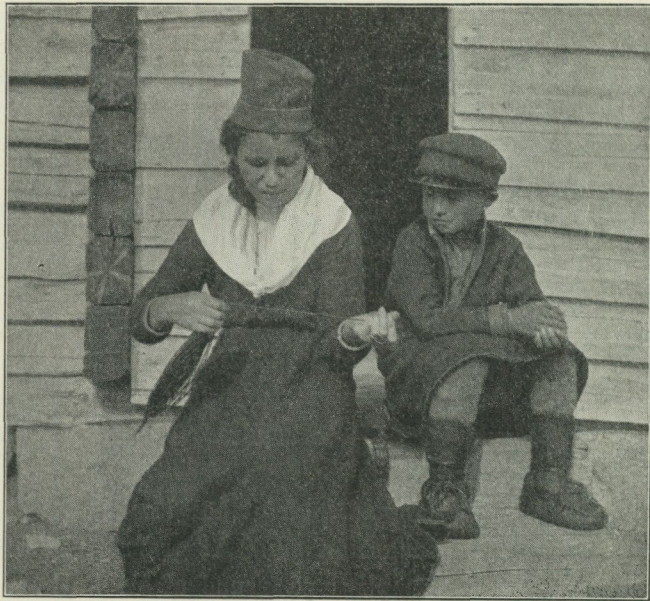
Fig. 1. Den enkla strängen tvinnas.

anskaffa andra tälningar. Fiskaren på Petsesuoloi, där inga kvinnor bodde, hade erhållit granrotstälningar från Huki, där modern i familjen brukade tillverka sådana. Vid ett besök i Huki antecknade jag nedan meddelade uppgifter om dessa tälningars framställande och fick dessutom taga de här bifogade fotografierna af dottern i familjen, medan hon är i färd med att tvinna ifrågavarande tälningar.