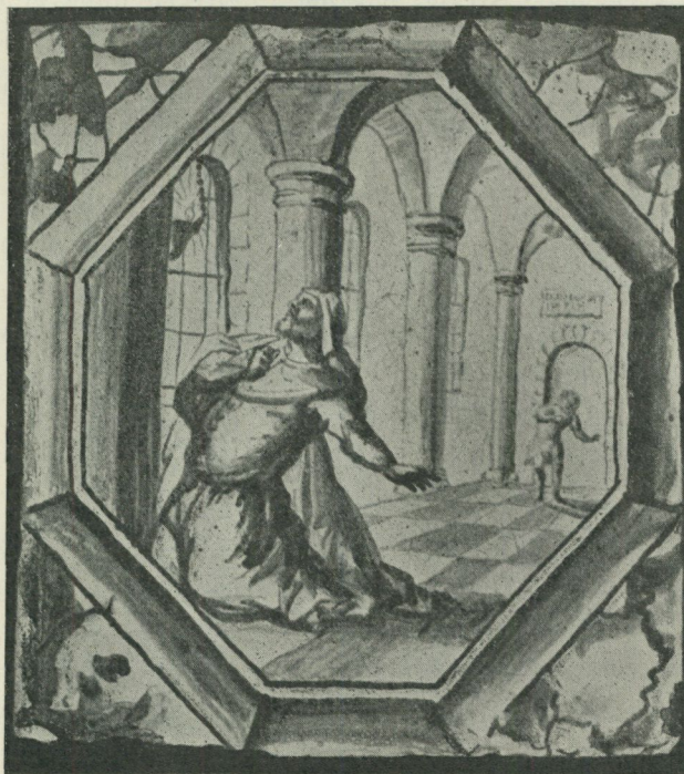
Fig. 2. Rörstrandskakel. N. M. 118 001 b

dessutom en 6 à 8 kakel med samma sexsidiga inramning af midtpartiet som å dessa. Denna grupp har en afvikande ton på den hvita glasyren från öfriga i kakelugnen förekommande kakels, så jag skulle hålla för troligt, att öfriga kakel af besläktadt utförande, t. ex. sådana med en djupblå ring kring midtfältet, 1 tillhöra andra brän-