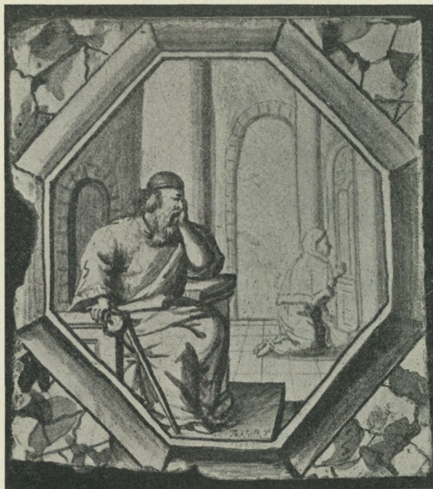
Fig. 1. Rörstrandskakel, sign. Thelott. f. 1727 St. N. M. 118 001 a.

Med om möjligt mera bestämdhet kan man kanske numer anse, att dessa blå och hvita kakel, som så rikligt förekomma i Stockholm, också tillverkats här i staden, sedan man påträffat den grupp kakel — ibland hvilka tvenne äro signerade — som här skall bli föremål för ett omnämmande.