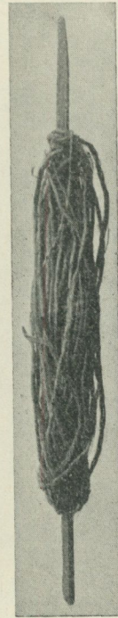
Fig. 2. Pinne med pålindad sträng. c:a \frac{1}{4} af nat. st.

Återstår så hoptvinnandet af två dylika strängar till en färdig täl, hvarvid man går till väga på följande sätt. Sedan tvenne pinnar fyllts på det sätt nyss angifvits, tvinnar man ändarna på hvardera strängen i hvarandra, så att man får en sammanhängande sträng, hvaraf sålunda ungefär hälften är upplindad på hvardera pinnen. Sedan den, som arbetar, vikit ihop den nu sammanhängande strängen på midten, föres den ena pinnen rundt något lämpligt föremål (jfr fig. 3, som visar att i detta fall en stol kommit till användning härför) och så tillbaka, samt fasthålls under ena foten. Med den andra pinnen utföres rundt denna sträckta sträng, en tvinnande rörelse, äfvenledes här medsols, jfr bilden, som således gifver en tvinning motsatt den förra. 2