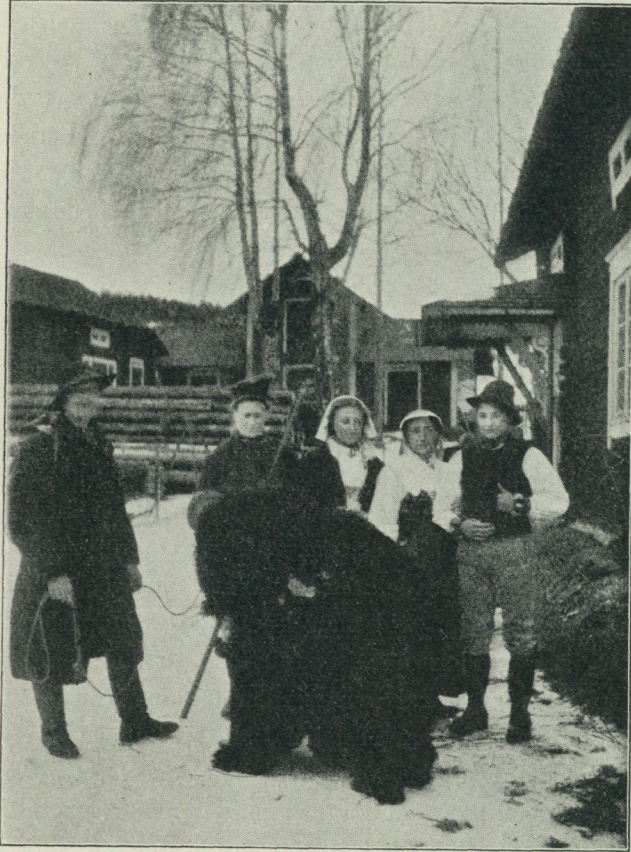
Fig. 3. Mats-firande med »björn» i Gagnef.

öfver åkrarna tog genvägen öfver till byn, där min medhjälpare bodde, men han befanns villig till att förfölja brudparet och väpnade med kamera och blyxtljus bar det i väg af till Tallbacken, där vi