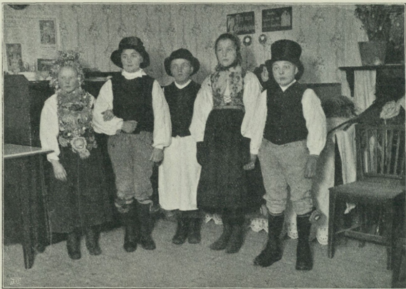
Fig. 1. Mats-firande med »brud och brudgum» i Gagnef.