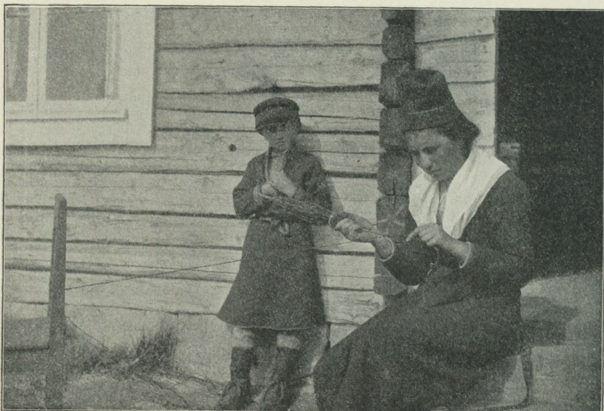
Fig. 3. Det slutliga hoptvinnandet nyss påbörjadt.

Kringförandet af pinnen rundt den spända strängen går synnerligen jämnt och smidigt; de alltjämt nya fattningarna, som tillåta pinnen att hastigt föras omkring strängen ifråga, följa nästan omärkligt på hvarandra. Allt emellanåt hopdrages det tvinnade stycket genom att höger hand med pinnen föres åt sidan; det är denna ställning, som fig. 3 åskådliggör. Man ser här för öfrigt att arbetet med hoptvinnandet af den färdiga lina just begynt. Denna färdiga lina, sådan den skall användas till öfvertälmar på nät, kallas resjme .