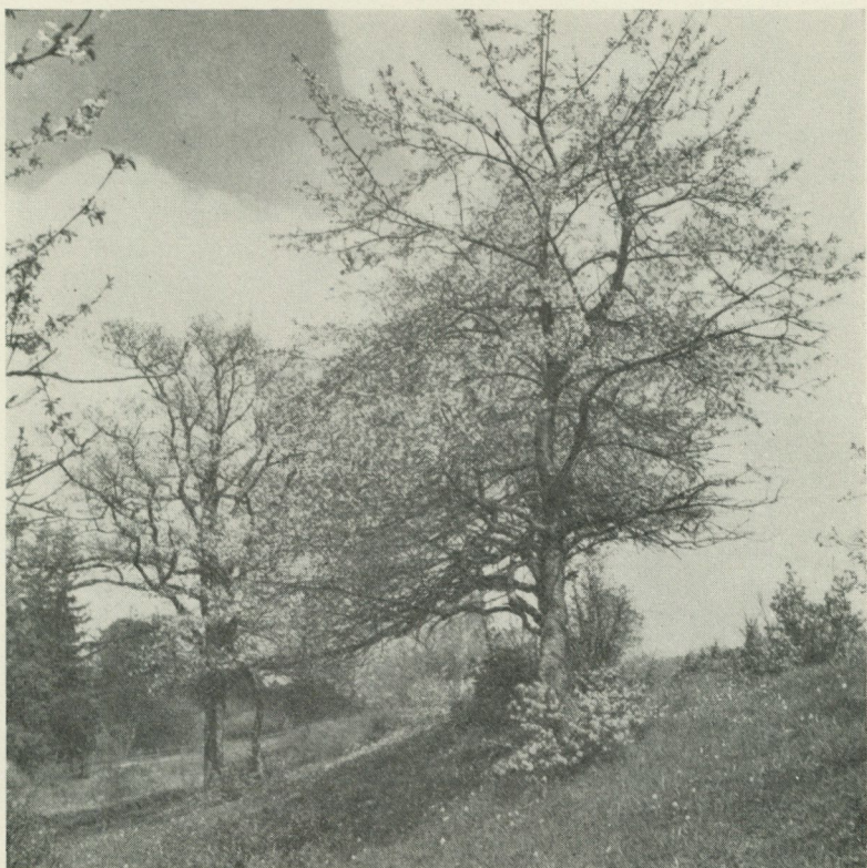
Blommande vilda körsbärsträd på Kinnekulle bidraga till traktens säregna tjusning. Foto Ivar Anderson 1946.

Kinnekulle. Om Kinnekulle sägs, att den är med "Skiön Granskough bewäxt". Samma område upptages på en ännu äldre karta av år 1659 över "Cronones fredkalladhe Parker" (läns- och häradskartor P 12). På 1740-talet övergick emellertid kronoparken på Kinnekulle att bliva sockenskog och fördelades på hemmanen. Därmed var en månghundraårig tradition bruten. Sannolikt efter folkminnet uppgiver nämligen Österplan, att högkullen, kronoparken, tidigare under 1600-talet varit en allmänning. Detta är riktigt. Kinnekulle upptages nämligen redan i tillägget till Västgötalagen (IV. 11:2) bland allmänningsbergen