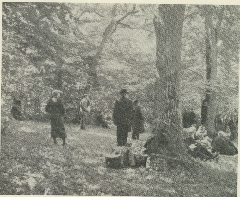
Frälsningsarméns Kinnekulledag firades med bön och sång i Munkängen. Foto Ingalill Grantlund 1946.

sålda. Sedan fortsatte kommersen med klarbär som betingade 40—60 öre litern.