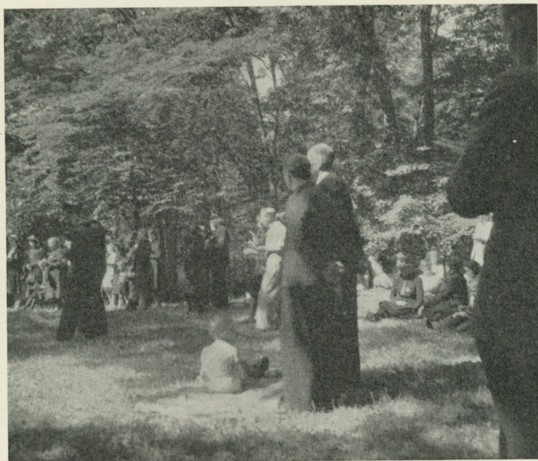
Från Frälsningsarméns möte i Munkängen. I bakgrunden stod och låg folk, och körsbärspåsarna tömdes snabbt.

säteri åren 1854—55 (karta i Lantmäteristyrelsens arkiv med signum P 146 15 2 ) är det påfallande, hur bland ägorna till torp efter torp och soldattorp upptages "husplats med trädgård".