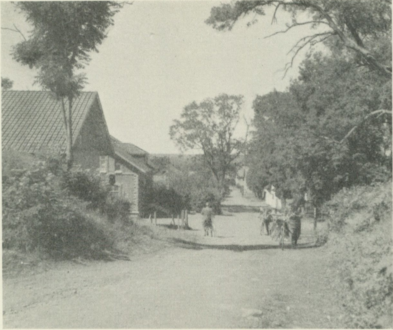
Förr stodo försäljarna vid vägen ner till handelsboden och mejeriet. Foto Ingalill Granlund 1946.

mycket hänsynslöst på trädgårdarnas körsbärsträd. Särskilt gick man illa åt träden vid småställena, som inte kunde hålla vakt.”