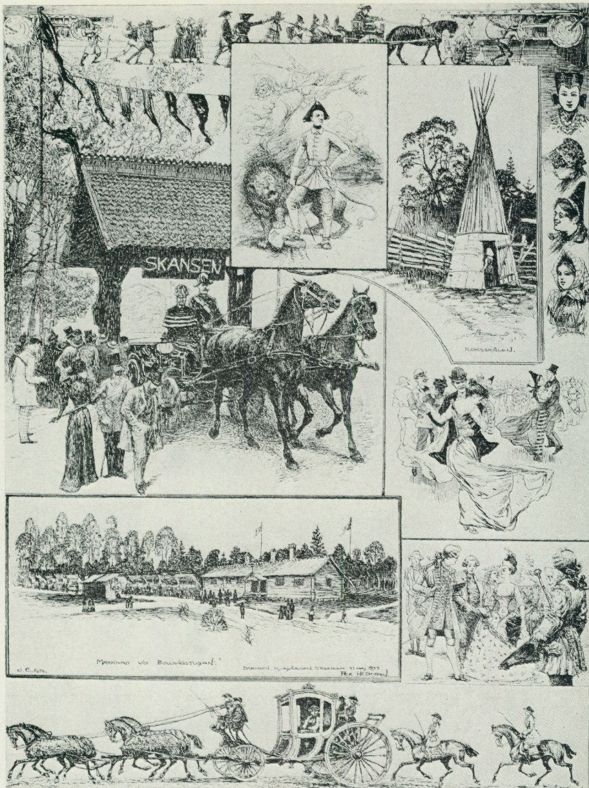
1. Den första vår- festen på Skansen 1893. Teckning för Svenska Familj- Journalen Svea av Per Hedman.

delen av planen kom aldrig att full- följas. Hazelius efterträdare hade andra tankar om hur ett museum skulle användas och längre fram i ti- den hade de nationella festerna gått ur modet. Men på Skansen kom den