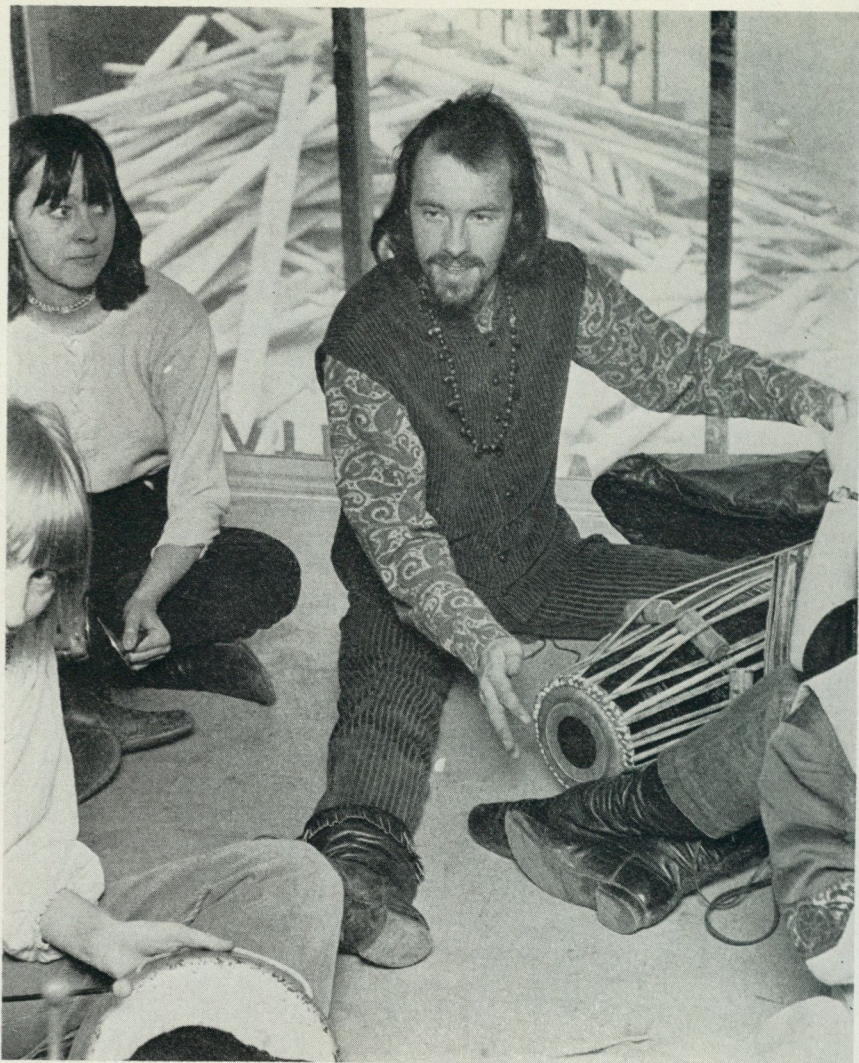
8. Folkmusik från hela världen har nu blivit var mans egendom. Foto Svenska Dagbladet 1969.

industrier. Medlemmarna i föreningen gör själva uppteckningar av sångmaterial efter traditionsbärare och då och då presenteras också sånger sjungna direkt av meddelarna. Intresset för detta material har nu i snart ett decennium varit oerhört stort bland den brittiska ungdomen och genom vissa institutioners hjälp har också den