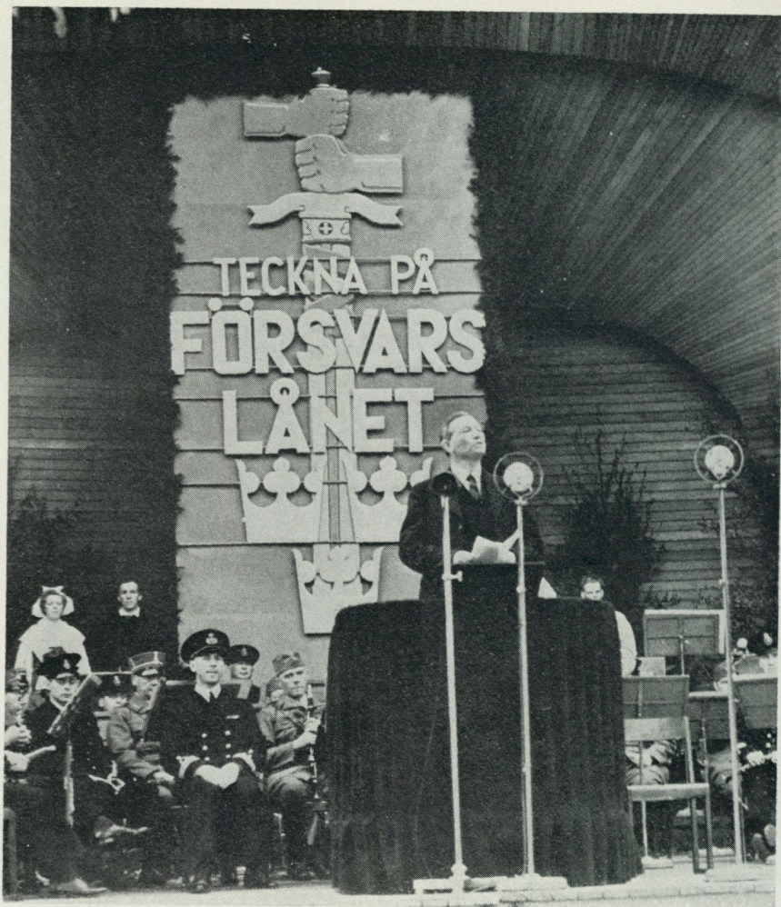
5. Försvarslånets medborgarfest på Skansen den 25 maj 1940, med dåvarande försvarsminister Per Edvin Sköld i talarstolen.

mang som krävde en stor frivillig insats av en rad olika organisationer. Av besökssiffrorna att döma går det inte att ta miste på dessa ofta pompösa historiska skådespels popularitet.