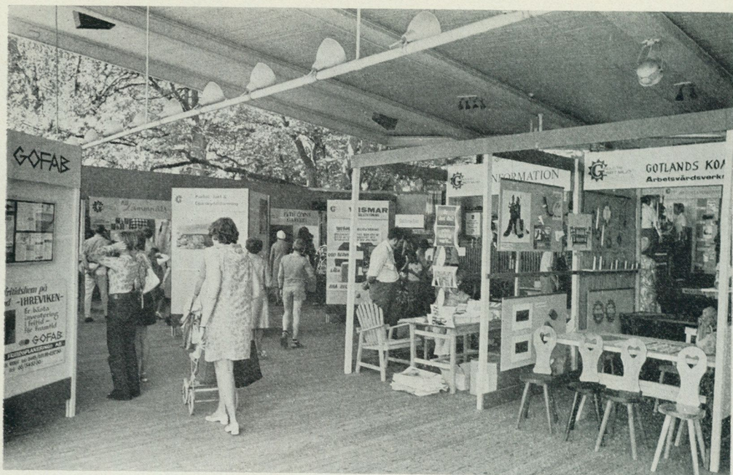
12. Näringslivsutställning under Gotlandsveckan på Skansen 1970.