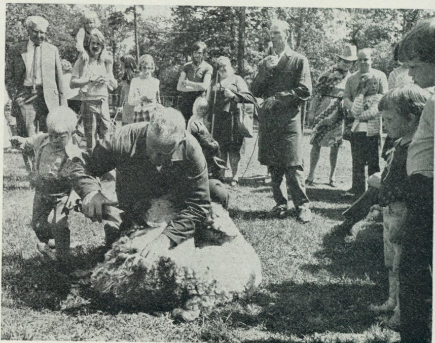
13. Demonstration av fårklippning i Sommarhagen under Gotlandsveckan.