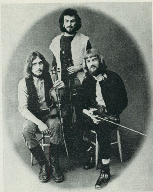
6. Skäggmanslaget, flitiga gäster på 1970-talets Skansen.

Vilka yttringar tar sig då denna nya våg? Först och främst skall fastslås att rörelsen denna gång är klart internationell. Den mest påtagliga yttringen gör sig kanske gällande inom folkmusikens område jorden runt. Här hemma har den gamla spelmanstraditionen kommit till heders igen och en stor grupp artister har numera dessutom på sin repertoar rent medeltida ballader. Men man går inte alltid så långt tillbaka i tiden. I Sverige har mycket av 1800-talets och det tidiga 1900-talets folkliga sång och musik letats fram ur sina gömmor. Likartat är förhållandet i flera andra länder. Så t. ex. ingår i Storbritannien nu såväl medeltida ballader som kolgruvearbetarnas sekelskiftessånger i dagens populära musiklistor. Internationellt spridd är bl. a. afrikansk och sydamerikansk folkmusik och naturligtvis den nordamerikanska s. k. Country and Western-musiken.