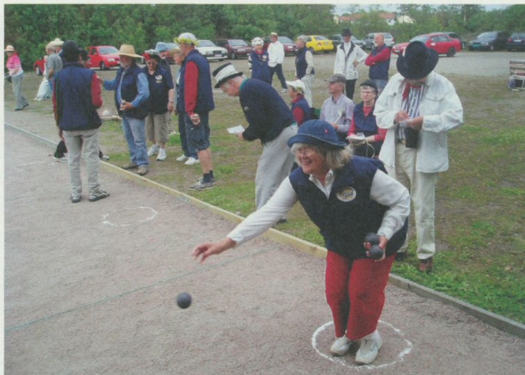
I Sverige är boules populärt även bland kvinnor.

han i sin Saab till Humlegården för att spela med de spelare som brukade hålla till där. Bilden av prinsen i basker halvsittande i en ring beredd att kasta klotet är nog tämligen bekant.