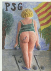
En liten »Fanny« i gips med en målad mun på vänstra skinkan i klubben »La pétanque Saint Génésienne«, Saint-Génis-des Fontaines.