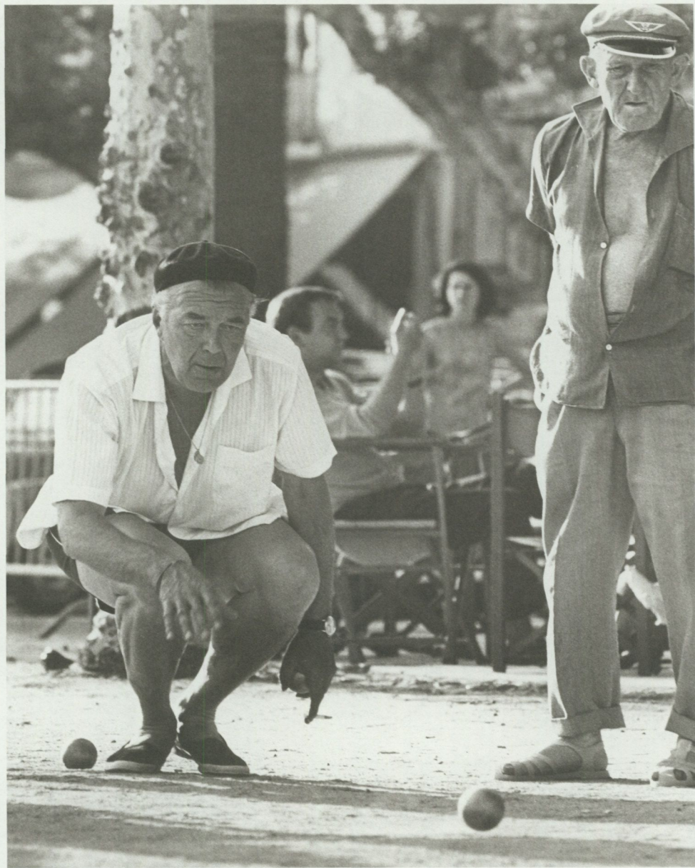
Prins Bertil lägger ett klot i Sainte-Maxime.